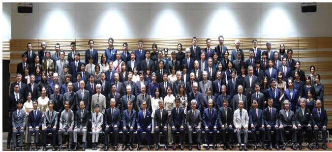
奈良県立医科大学麻酔科学教室 50周年記念祝賀会集合写真