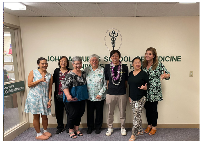
留学先のスタッフと(中央が教授)

Mainland への留学でないので不安な面もありましたが、日常生活では住民と観光客で住み分けがされており、英語圏ならではの経験がたくさんできました。一方で、英語に疲れた時は日本語で活動ができる場所もあり、麻酔科医の大好きなオンオフのある生活で自分には良い留学先だったと思います。このような貴重な経験をさせていただきありがとうございました。この経験を今後を活かし、医局にも何か還元できれば嬉しいです。Mahalo.