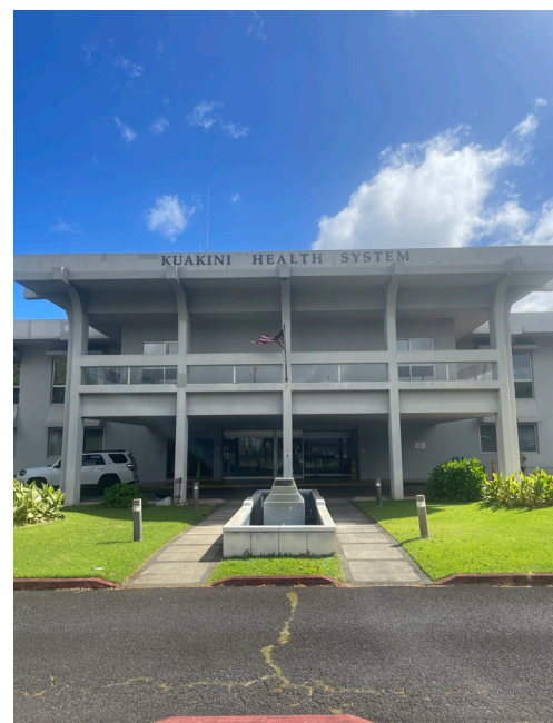
Kuakini Medical center