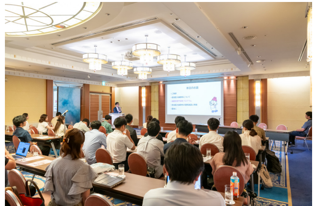
奈良医大麻酔科研修プログラム説明会の様子

力してまいります。今後ともご指導・ご鞭撻のほど、何卒よろしくお願い申し上げます。