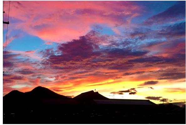
土庫病院からみた夕陽

今回の連携をきっかけに、奈良医大麻酔科学教室の皆様との結びつきがさらに強まることを期待しております。どうぞ今後ともよろしくお願い申し上げます。