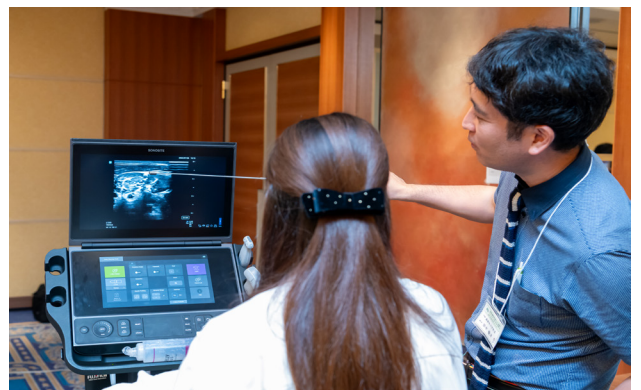
ハンズオンセミナーの様子